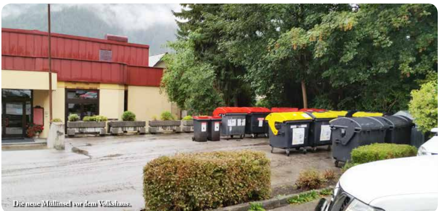
Die neue Müllinsel vor dem Volkshaus.

Erwähnenswert an dieser Stelle wäre, dass Sperrmüll (300 kg pro Jahr und Haushalt) GRATIS von Montag - Donnerstag von 7.00- 16.00 Uhr und Freitag von 7.00-15.00 Uhr beim A.S.A. Abfallservice in St. Georgen abgegeben werden kann.