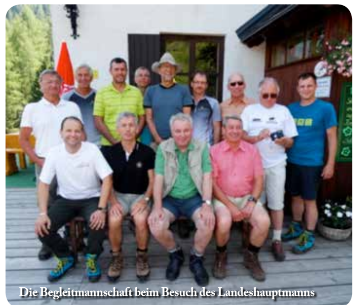
Die Begleitmannschaft beim Besuch des Landeshauptmanns