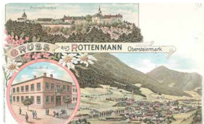
Auf einer Rottenmanner Litho-Ansichtskarte aus 1898 ist bereits das „Hotel Goldbrich“ zu sehen