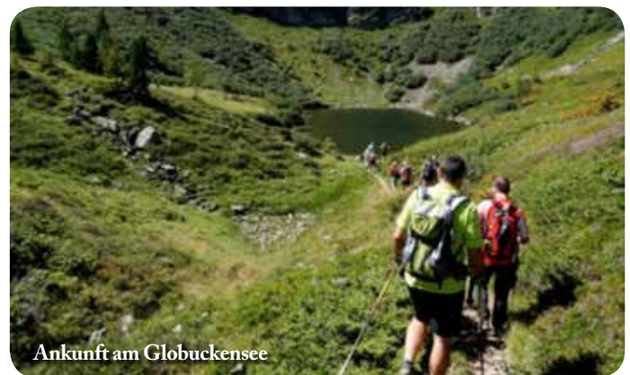
Ankunft am Globuckensee

Das Ziel war dieses Mal die Rottenmanner Hütte in den Niedereen Tauern. Eine Wanderung entlang des Pilgerweges der Welt-