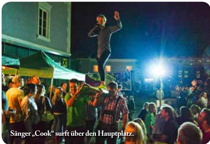
Sänger „Cook“ surft über den Hauptplatz.

G eschätzte 1000 Besucher folgten der Einladung des Tourismusverbandes Rottenmann unter ihrem Vorsitzenden Manfred Grieser zum Open Air am Rottenmanner Hauptplatz