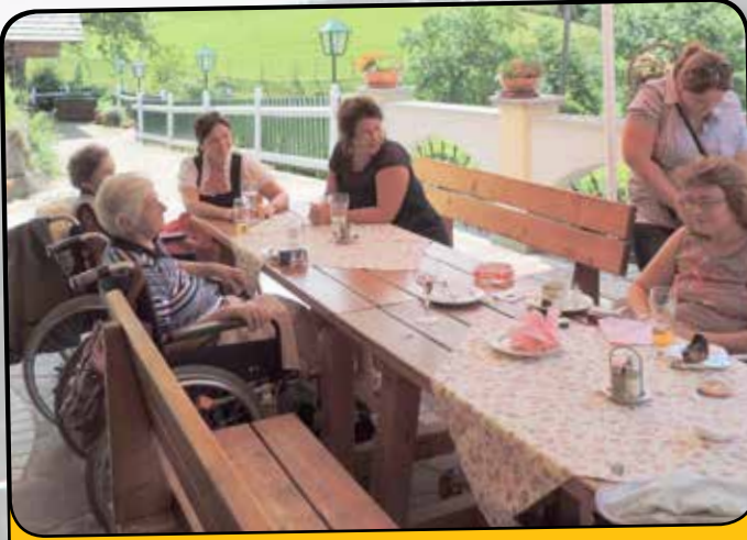
Besuch auf der Peterbaueralm