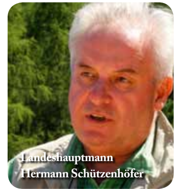
Landeshauptmann Hermann Schützenhöfer in der Entwicklung des Tourismus dar und sind somit ein unverzichtbarer Teil unserer Gesellschaft.

Naturreligionen wurde für wichtig erachtet. Der Landeshauptmann zeigte sich beeindruckt von dieser Idee und der Vielfalt der künstlerischen Ergebnisse. Er bedankte sich bei den alpinen Vereinen für den Einsatz zur Erhaltung und Erneuerung der alpinen Infrastruktur, die den vielen Wanderern und Bergsteigern in Form von markierten Wegen und gemütlichen Schutzhütten zu Gute kommen. Die alpinen Vereine stellen einen der Stützpfiler