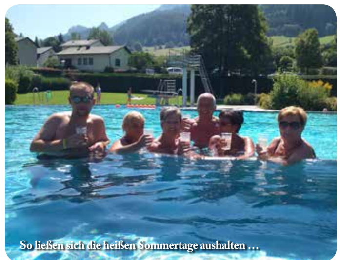
So ließen sich die heißen Sommertage aushalten ...

raturabkühlung im September schloss das Freibad aus wirtschaftlichen Gründen mit 4.