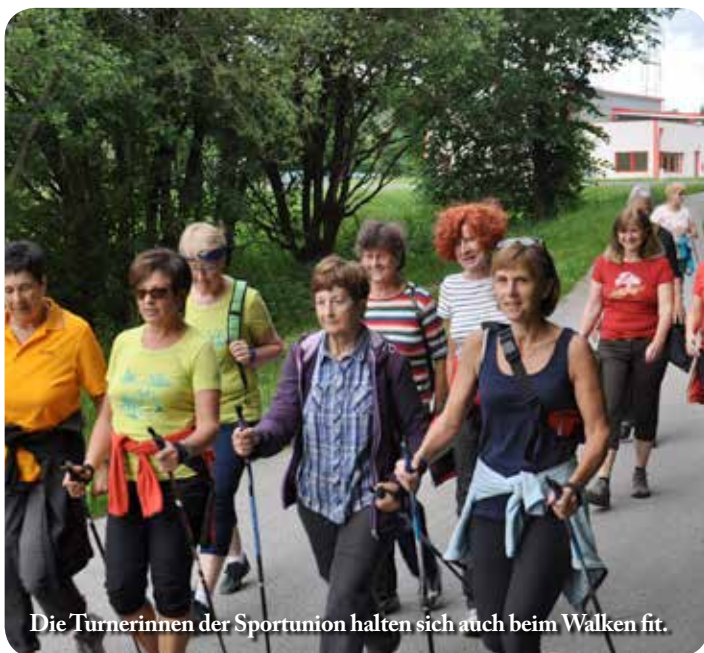
Die Turnerinnen der Sportunion halten sich auch beim Walken fit.

F itness und Wohlbefinden nehmen in unserem Leben einen immer höheren Stellenwert ein. Dass sportliche Betätigung dazu einen großen Teil beitragen kann ist heute klar erwiesen. Umso besser, dass es Vereine gibt, die genau das im Angebot haben, wie auch die Sportunion Rottenmann. Hier kann man mit ausgebildeten Trainern seine Fitness steigern. Die Sportunion bietet jeweils am Donnerstag in zwei Gruppen ein breit gefächertes Turnangebot in der Neuen Mittelschule Rottenmann an. Hier gehören Aerobic, Gymnastik