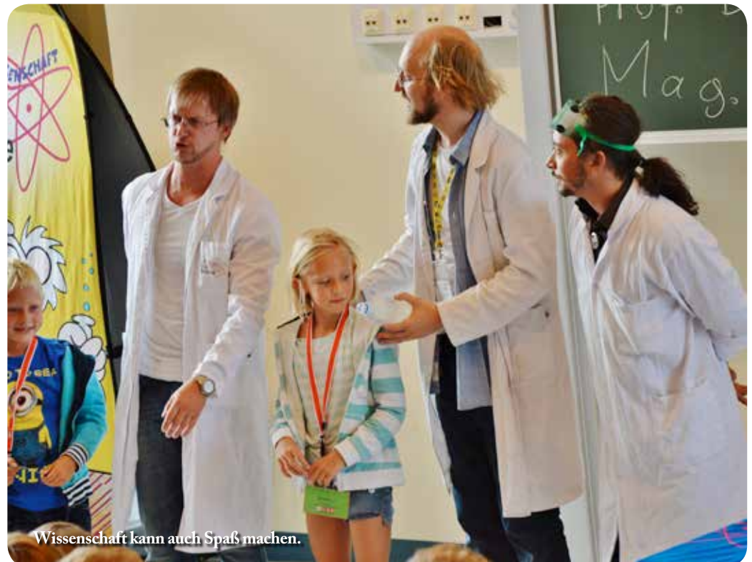
Wissenschaft kann auch Spaß machen.

Die Idee zur KinderUni im Bezirk Liezen am Universitätszentrum Rottenmann stammt von