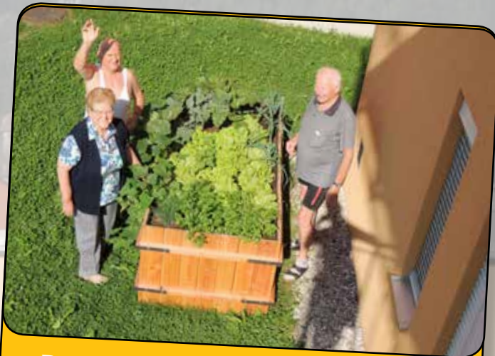
Danke für's Hochbeet, Hr. Bürgermeister