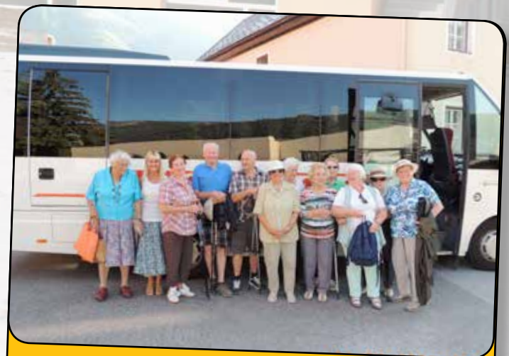
immer auf Achse