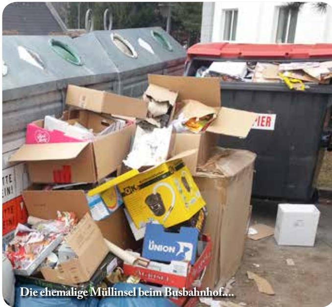
Die ehemalige Müllinsel beim Busbahnhof...