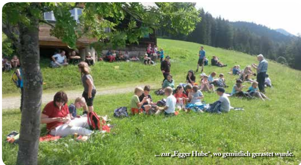
... zur „Egger Hube“, wo gemütlich gerastet wurde.

Bei bestem Wanderwetter marschierte die bestens gelaunte Gruppe mit den Schulkindern,