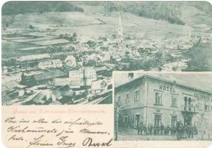
Ansichtskarte aus 1900