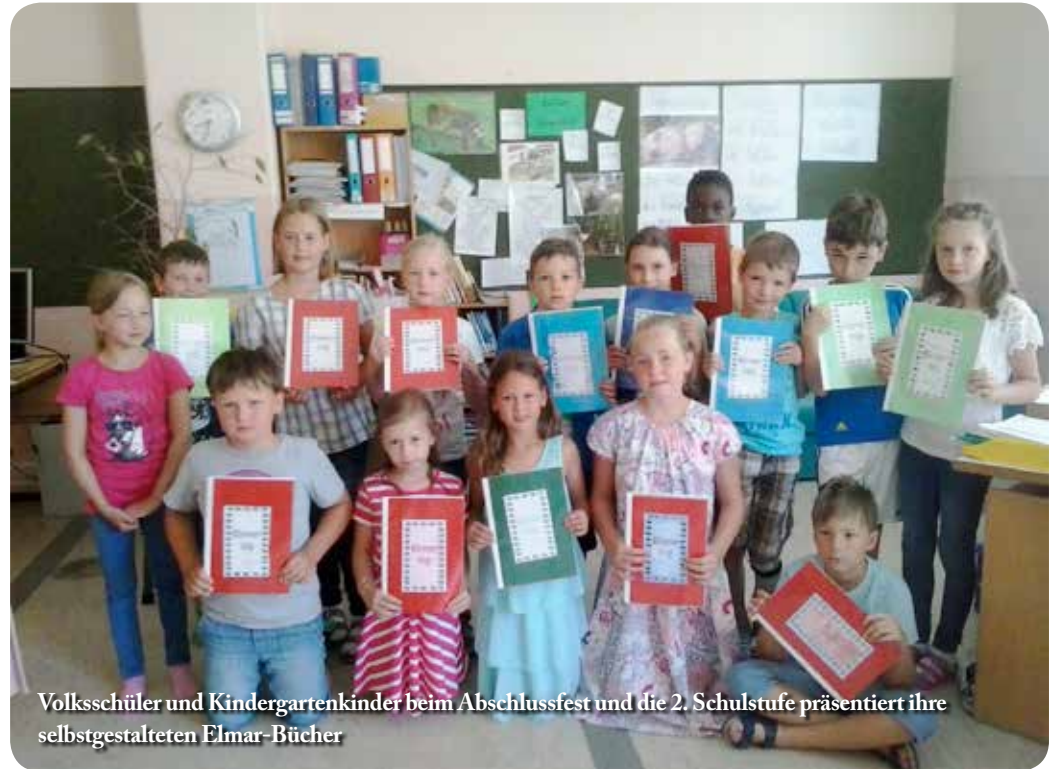
Volksschüler und Kindergartenkinder beim Abschlussfest und die 2. Schulstufe präsentiert ihre selbstgestalteten Elmar-Bücher