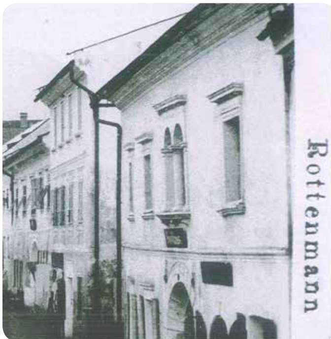
Bevor es zum „Hotel Goldbrich“ wurde, war im Haus eine „Handlung“ untergebracht