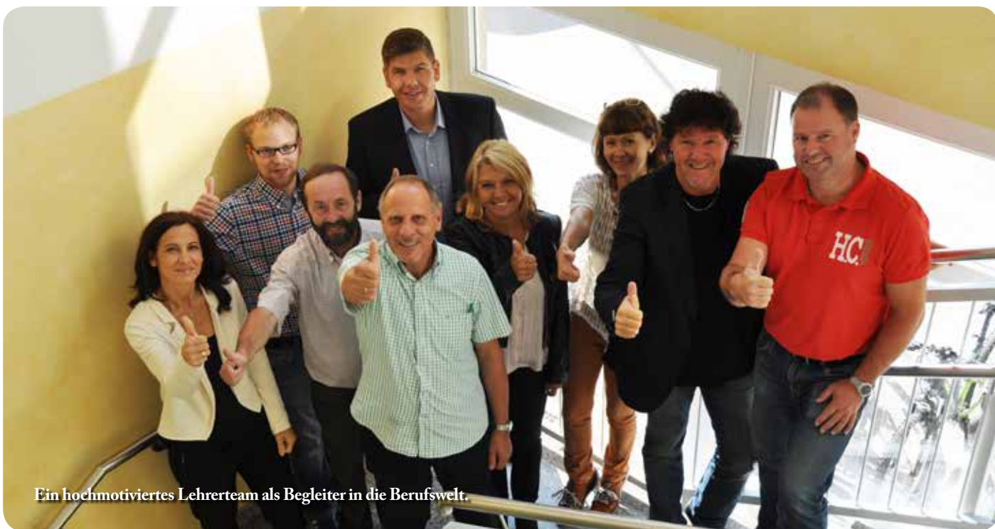
Ein hochmotiviertes Lehrerteam als Begleiter in die Berufswelt.

M it sechs berufsbezogenen Fachbereichen und den Schulschwerpunkten „Sport – und Berufsorientierung“ zählt die PTS-Rottenmann zu den berufs- und praxisnahen Schultypen im Bezirk Liezen. Die umfangreiche Angebotspalette in der praktischen Berufsvorbereitung erstreckt sich von Metall, Elektro-Kfz, Bau und