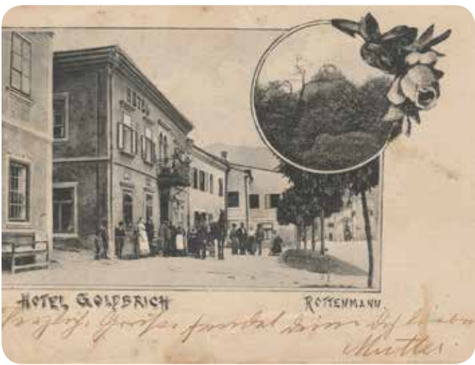
Hotel Goldbrich samt Schloß Strebau mit der „Schlangenlärche“