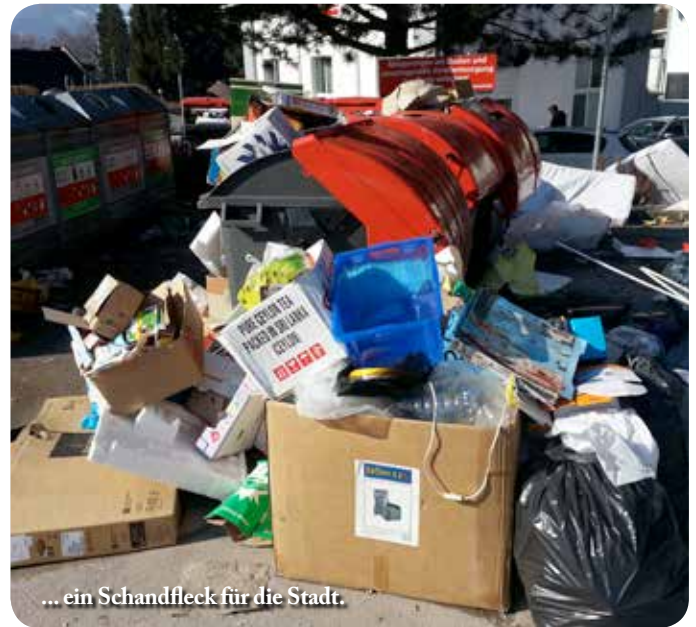
... ein Schandfleck für die Stadt.

W ie die meisten Bürger der Stadt Rottenmann schon bemerkt haben, hat die Stadtgemeinde Rottenmann mit Absprache der Städtischen Betriebe und des Umweltausschusses die Müllinsel beim Busbahnhof aufgelassen.