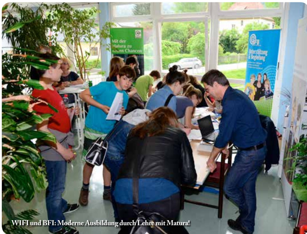
WIFI und BFI: Moderne Ausbildung durch Lehre mit Matura!