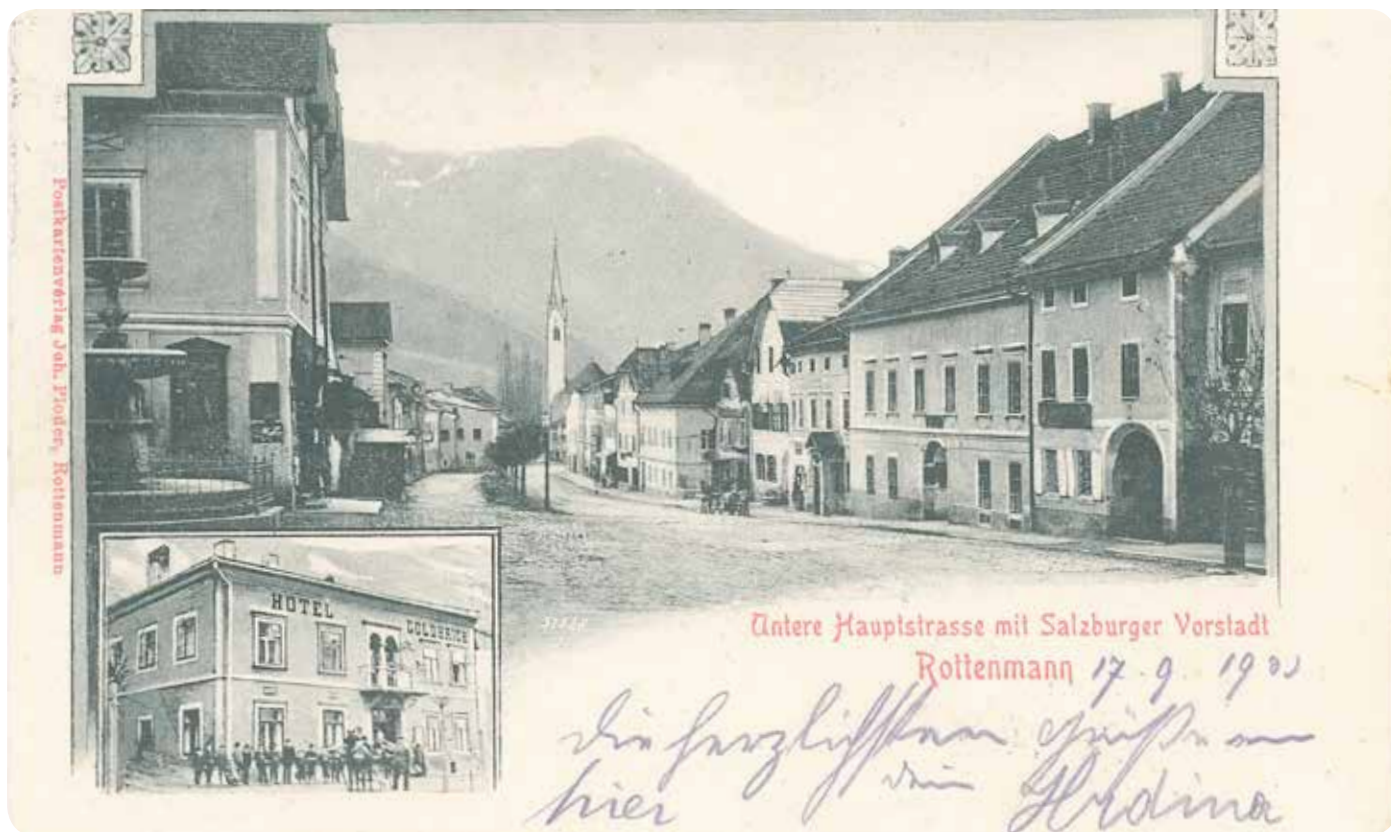
Das ehemalige Hotel Goldbrich ist in der Unteren Hauptstraße gelegen – Ansichtskarte aus 1903