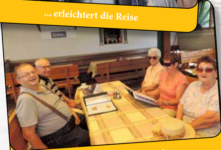
...im Berggasthof Zottenberg