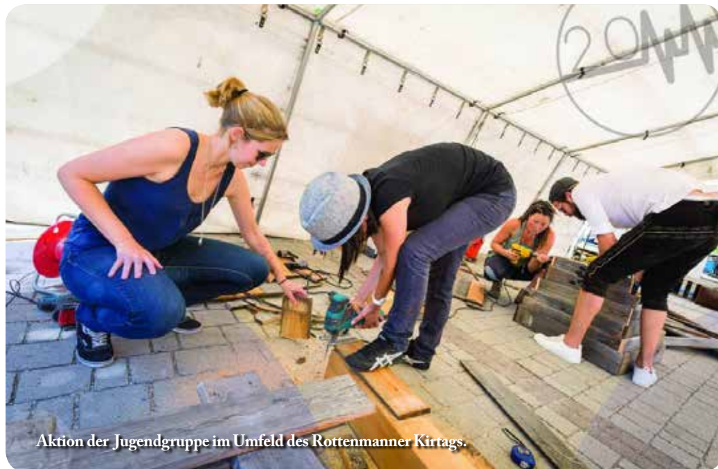
Aktion der Jugendgruppe im Umfeld des Rottenmanner Kirtags.

Als erstes sichtbares Zeichen findet man den Markttag vor