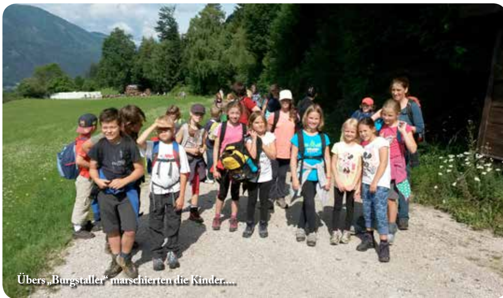
Übers „Burgstaller“ marschierten die Kinder....

Lehrerinnen und einigen Eltern direkt vom Schulhof los und „umrundete“ Bärndorf auf einer spannenden und abenteuerlichen Runde. Übers Anwesen Neubauer ging's zum „Kehrer Kreuz“, anschließend weiter über 's Burgstaller zur Egger Hube, wo gemütlich und ausgiebig gerastet und gejausnet wurde. Am Rückweg ging es über Stock und Stein über spannende Waldsteige Richtung Kaiserau und dann übers Anwesen Pacher und den alten Steinbruch-Weg zurück ins Dorf und zur Schule, wo der Elternverein bereits mit leckerem