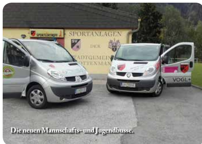
Die neuen Mannschafts- und Jugendbusse.

Nachdem die Kampfmannschaft des SVR bereits voll im Meisterschaftsbewerb aktiv ist, steigen nach den Sommerferien nun auch die Jugendmannschaften in den Trainings- und Spielbetrieb ein.