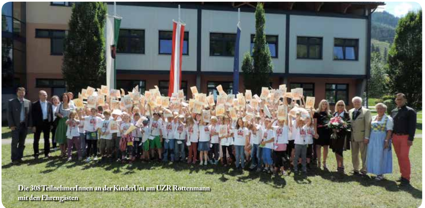
Die 308 TeilnehmerInnen an der KinderUni am UZR Rottenmann mit den Ehrengästen