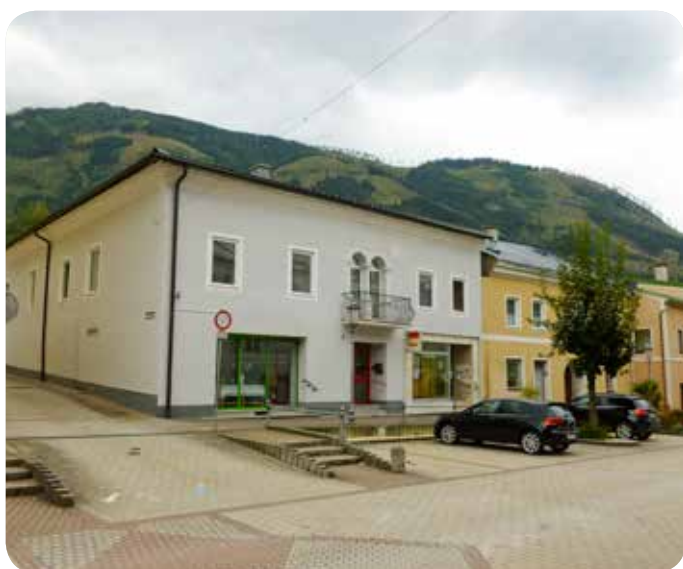
Das Gebäude Hauptstraße 96 und 96a, das heutige Haus Gira – Brabänder