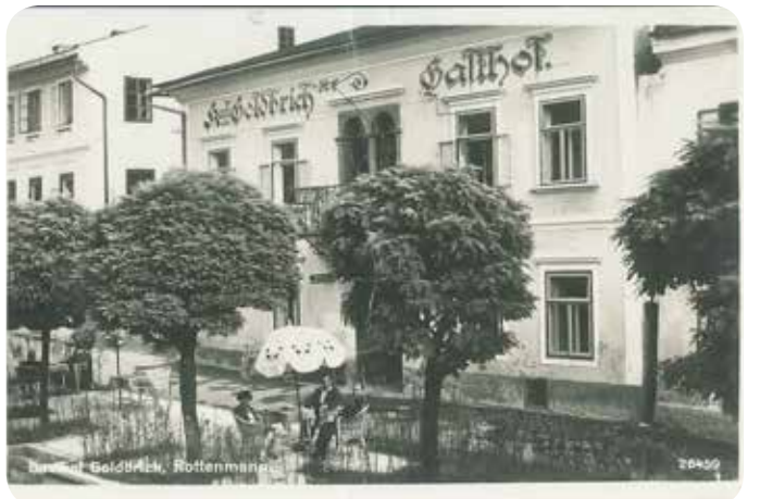
Karl Goldbrichs Gasthof um 1930 mit dem umgestalteten Gastgarten