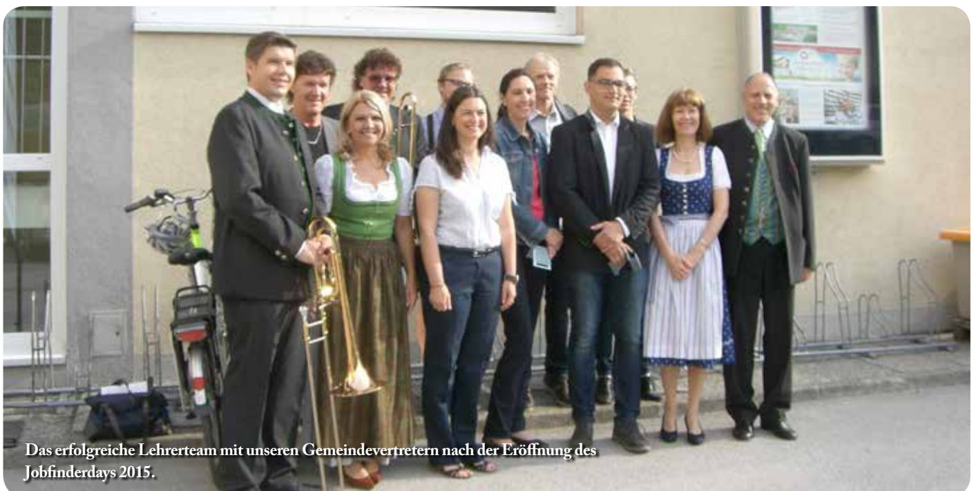
Das erfolgreiche Lehrerteam mit unseren Gemeindevertretern nach der Eröffnung des Jobfinderdays 2015.