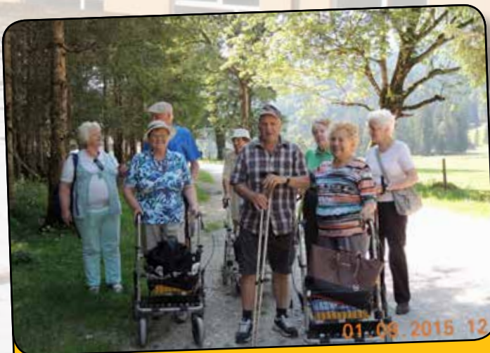
... bei schönstem Sommerwetter