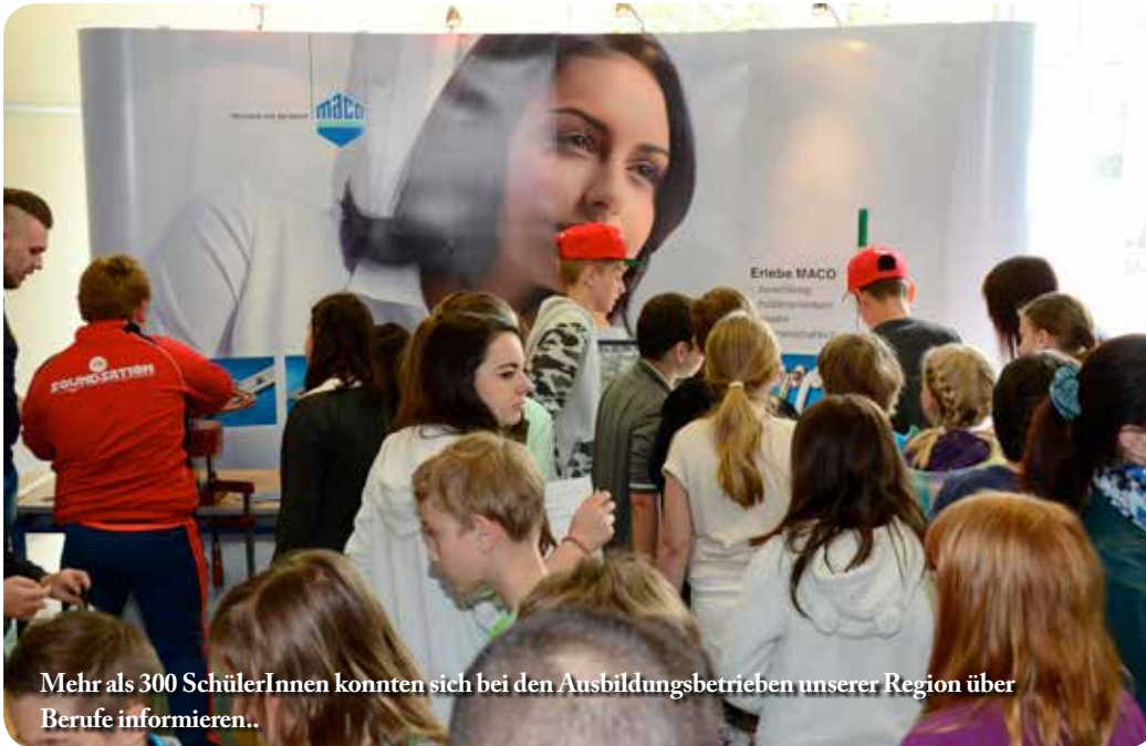
Mehr als 300 SchülerInnen konnten sich bei den Ausbildungsbetrieben unserer Region über Berufe informieren..

Nach dem Motto, „Schule braucht Wirtschaft – Wirtschaft braucht Schule!“, wurde an der Polytechnischen Zentralschule in Rotten-