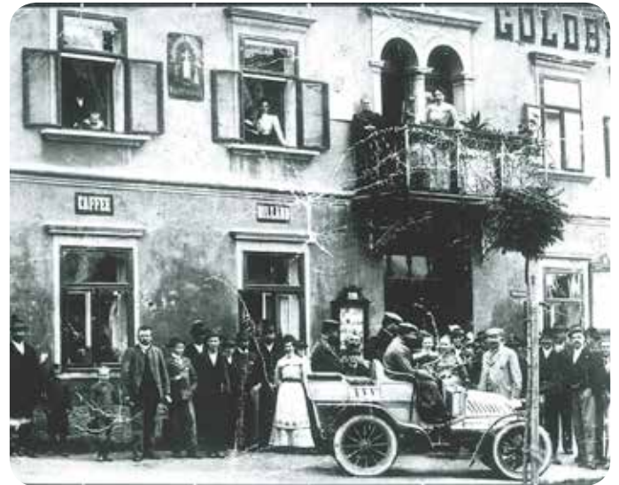
Hotel Goldbrich mit „Caffee“ und „Billard“ um 1910