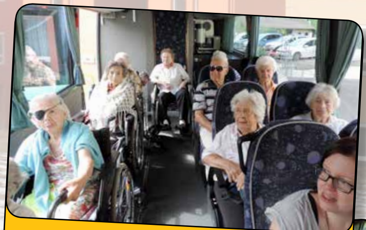
... erleichtert die Reise