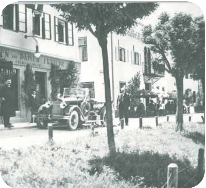
Friseur Langer mit dem Taxistandplatz neben dem Gasthof Goldbrich um 1930