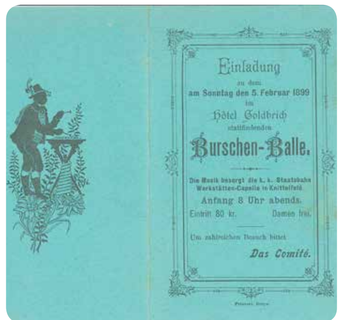
Einladung zum Burschen-Balle im Hotel Goldbrich 1899

Im Areal waren in den letzten Jahrzehnten verschiedene Lebensmittelmärkte untergebracht. In einem Teilbereich des Hauses besteht heute ein Friseurgeschäft.