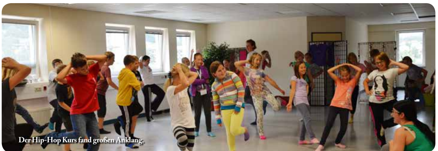
Der Hip-Hop Kurs fand großen Anklang.