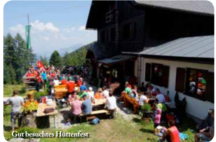
Gut besuchtes Hüttenfest

Nach dem bestens besuchten Berg- und Hüttenfest am Sonntag, 9.8.2015, gab es gleich am nächsten Tag einen ganz besonderen Besuch durch Landeshauptmann Schützenhöfer.