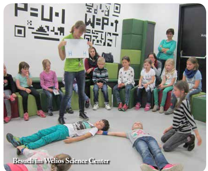
Besuch im Welios Science Center

naturwissenschaftliche Erfahrung das allgemeine Problemlöseverhalten der Schüler gefördert. Dank an den Elternverein für die großzügige Beteiligung an den Buskosten.