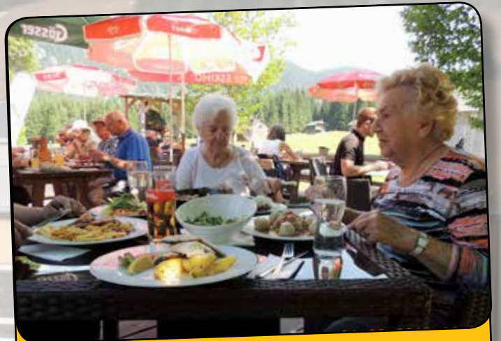
Ausflug auf die Blaa-Alm...