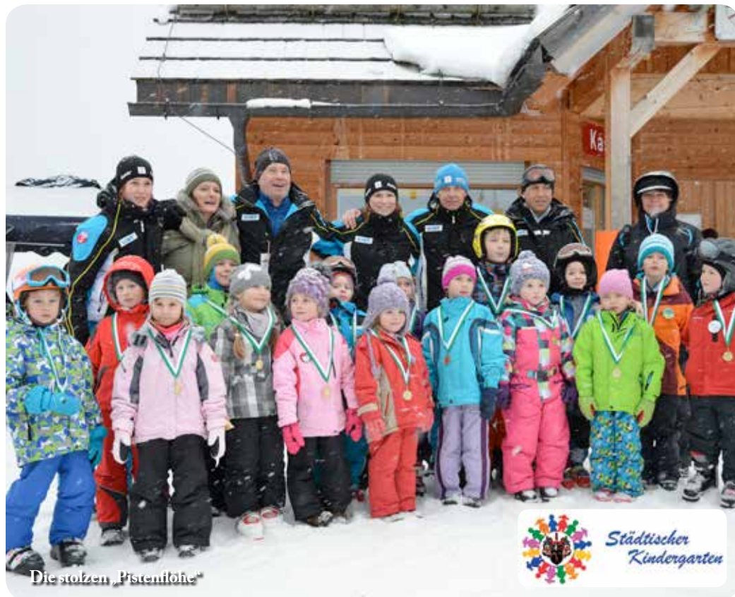
Die stolzen „Pistenflöhe“