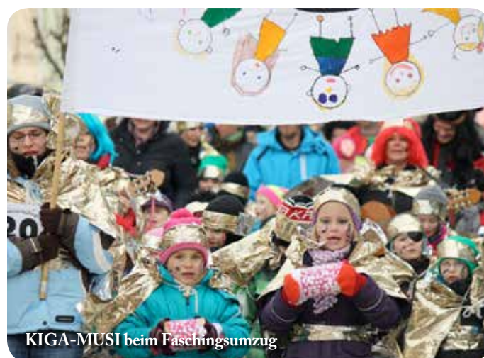
KIGA-MUSI beim Faschingsumzug

bei denen es auch kleine Preise zu gewinnen gab. Der Faschingsdienstag begann mit Faschings-Spiele-Stationen am frühen Morgen, die jedes Kind mit Spaß und Leichtigkeit bewältigen konnte. Am Nachmittag trafen sich dann alle Gruppen zum großen Faschingsumzug in der Schulallee. Verkleidet als KIGA-MUSI versuchten sie mit ihrer musikalischen Darbietung mit selbstgebastelten Instrumenten sogar der Stadtkapelle Konkurrenz zu machen. Der Applaus der Zuschauer war auf jeden Fall eine