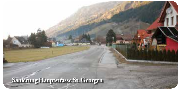
Sanierung Hauptstrasse St. Georgen

Hinsichtlich gemeinschaftlicher Gräderaktion mit dem Land Steiermark wurden die betroffenen Wegeigentümer seitens der Gemeinde verständigt. Als besonderes Service der Stadtgemeinde werden 80% der Ko-